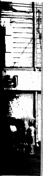
... få fat på efter- ... kølængder ... i 1990 holdt