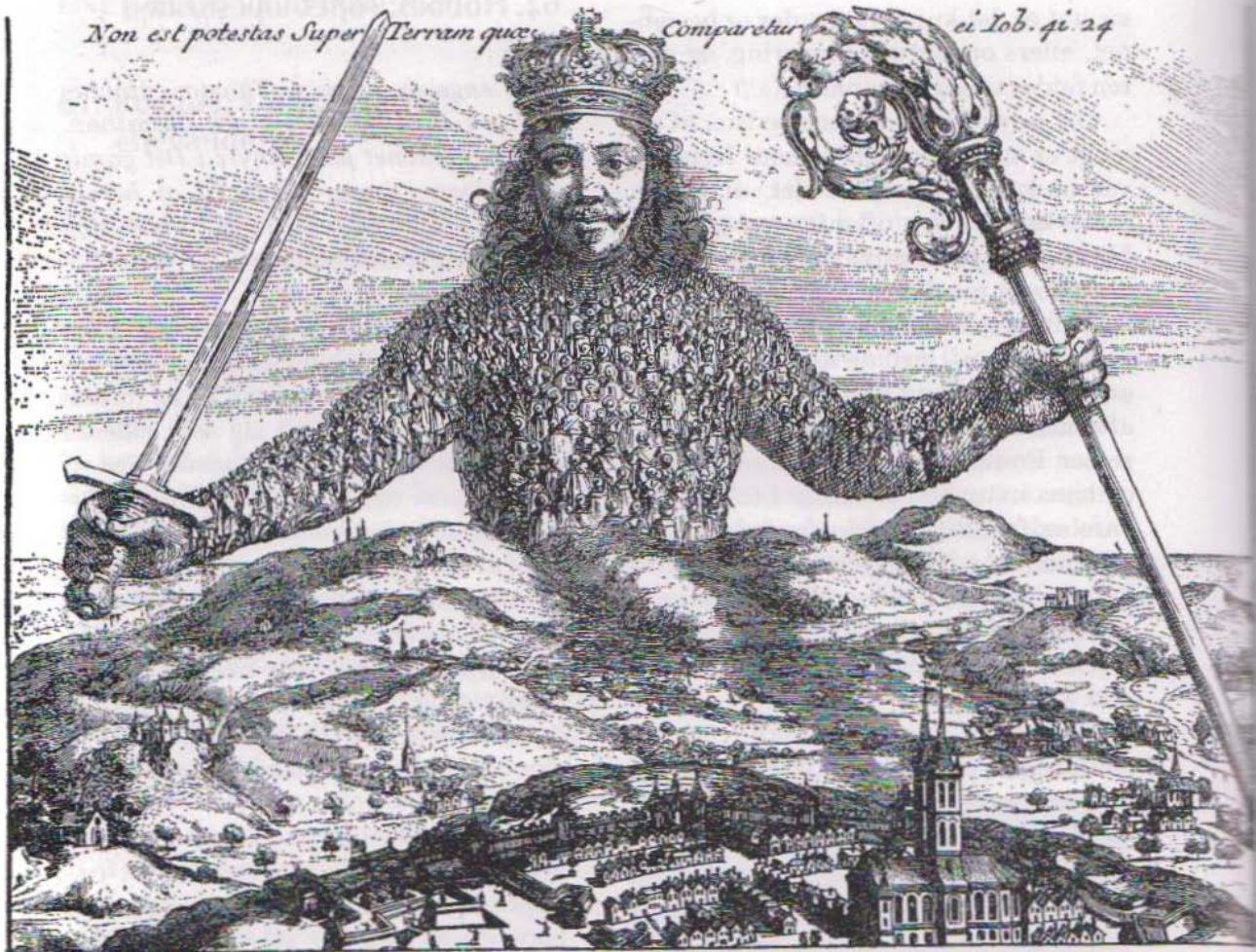
Titelbladet til Leviathan opsummerer Hobbes' politiske filosofi. Folket udgør den suveræne herskers krop. Til ham har de overladt både den verdslige magt (sværdet og kronen) og den kirkelige magt (staven).

Non est potestas Super Terram quae Comparetur ei Iob. 41. 24