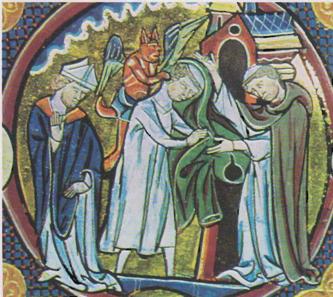
En novice aflægger klosterløfte og modtager sin munkekutte, samtidig befrier han sig fra denne verdens djævel. Bogmaleri fra middelalderen.

Man skal undersøge, om han virkelig søger Gud, og om han viser iver for guds-