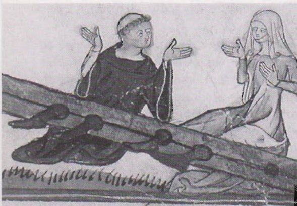
Munk og nonne der tydeligvis ikke har overholdt løftet om colibat. Samtidigt bogmaleri

hånd give det til de fattige, eller han kan ved en højtidelig overgivelse skænke det til klosteret uden at beholde noget til sig selv, da han jo ved, at han fra den dag ikke engang har ret til at råde over sit eget legeme. Altså skal man i oratoriet straks afklæde ham det tøj, han har haft på, og iføre ham klosterdragten. Det tøj, man tager af ham, skal lægges til forvaring i tøjdepotet, for at han, hvis han engang giver efter for Djævelens råd om at udtræde af klosteret – hvilket ikke må ske! – kan afklædes klosterdragten, førend han udstødes. Men sit dokument, som abbeden har taget fra alteret, skal han ikke få tilbage; det skal opbevares i klosteret.