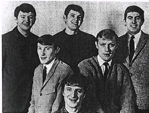
Cliff Bennett and the Rebel Rousers