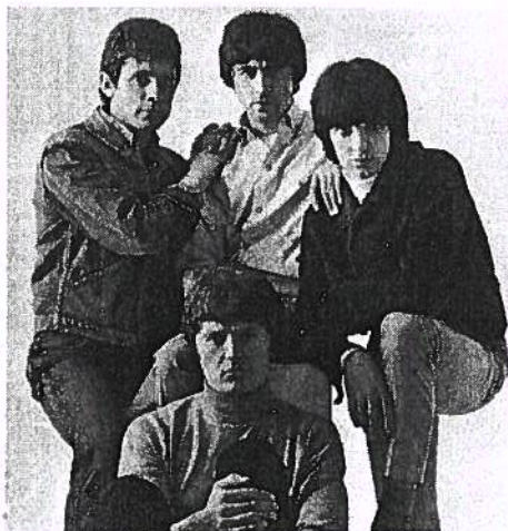
Swinging Blue Jeans