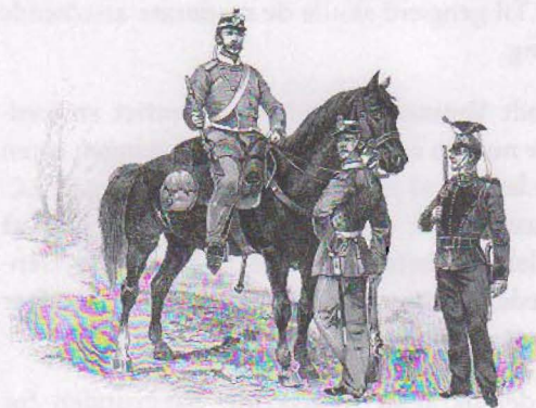
Gendarm og Livjeger.

I december 1885 mødtes Rigsdagen igen, dens møder kunne kun udsættes i to måneder. Men da man ikke kunne blive enige om en finanslov, blev Rigsdagen snart hjemsendt igen. Så kunne der atter udstedes en provisorisk finanslov. Og det blev det normale i de kommende år. Ethvert forsøg på at opnå normale forhold var slået fejl. Og takket være de provisoriske finanslove kunne Estrup skaffe midler til at bygge et omfattende fæstningsanlæg omkring København, som Venstre var modstander af.