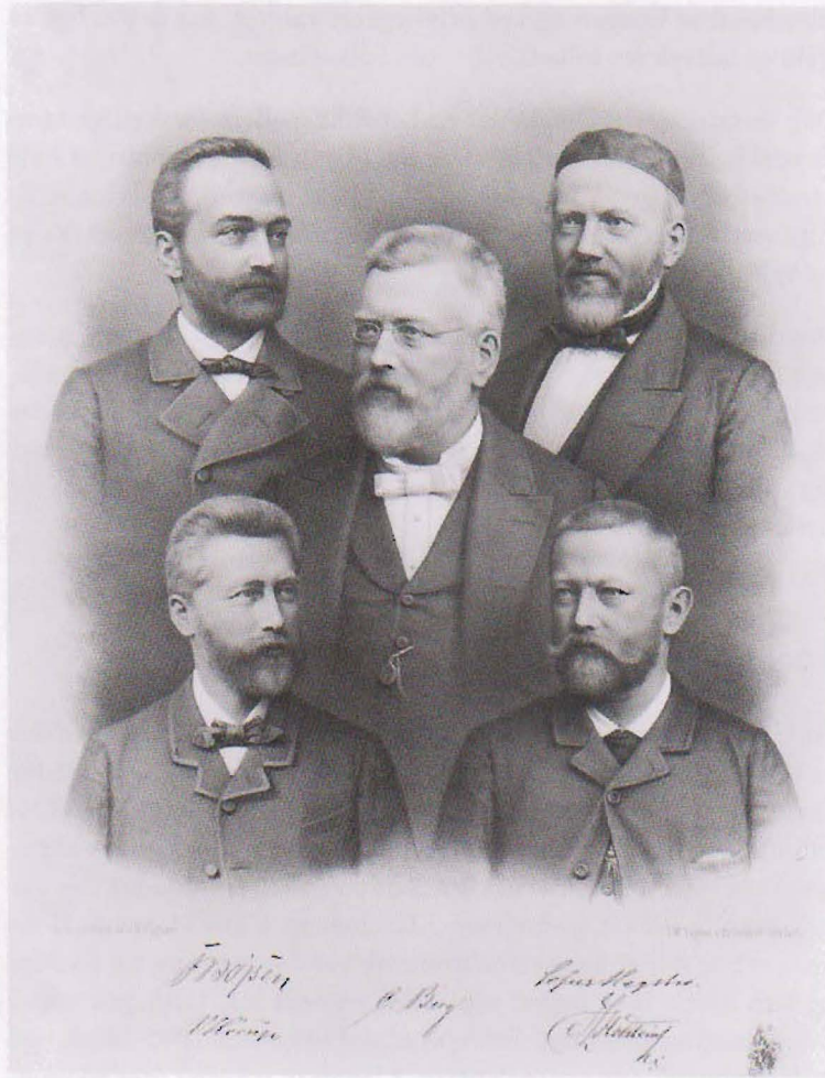
Litografi af Venstres fem førere med Venstres leder, Chresten Berg, i midten, den moderate Frede Bojsen til venstre øverst og den radikale Viggo Hørup for neden til venstre.

fordi finanslovsforslaget først skulle forelægges i Folketinget og behandles der, før det kom op i Landstinget. I praksis havde det siden 1850 givet Folketinget langt større indflydelse på de færdige finanslove end Landstinget. Hertil kom, at Folketinget havde større demokratisk legitimitet end Landstinget. Det var i højere grad end Landstinget udtryk for folkets vilje, fordi alle dets medlemmer blev valgt ved lige og almindelig valgret.