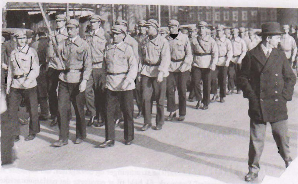
Fotos af uniformerede ungdomskorps, der marcherer; øverst KU'ere og nederst kommunistiske frontkæmpere.