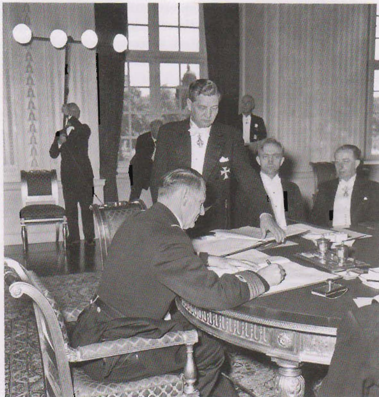
Foto af Frederik 9. (1947-1972), der underskriver den nye junigrundlov 1953, mens en stående statsminister Erik Eriksen ser til.

sen skulle dannes. Det lykkedes ikke at vinde kongen for tanken, og Rigsdagen benyttede lejligheden til at fastslå, at parlamentarismen var en central del af styreformen i Danmark, og at kongen anerkendte dette.